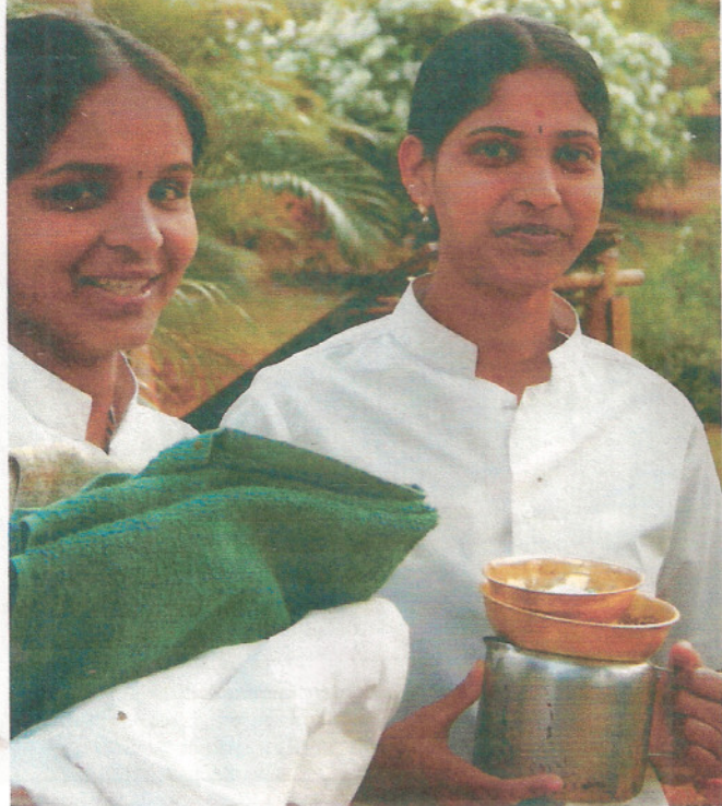
Freundlich und kompetent: Masseurinnen im Ivac

ARMIN THURNHER, Text —