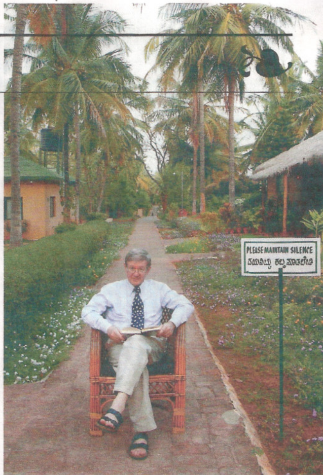
Der Autor nach der Kur, gesenkten Blutdrucks und verjüngt